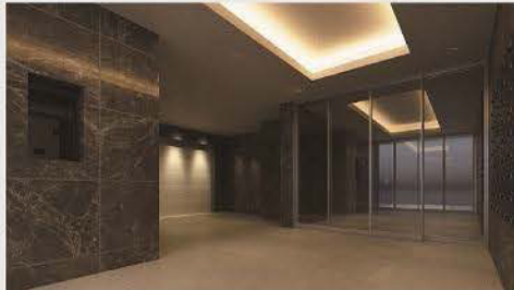
エントランスホール完成予想図

ワイドスパン・ワイドバルコニーがリビングダイニングと3つの居室に面している採光通風に優れたプラン。 さらに、ウォークインクローゼットやシューズインクローゼットなど大きな収納力も魅力。