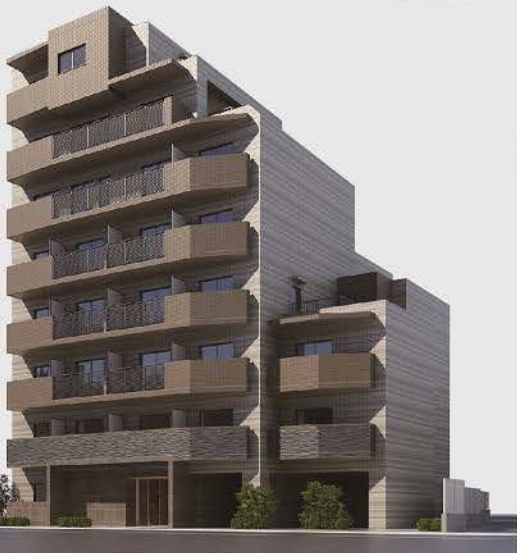
外観完成予想図 ※掲載の各完成予想図は設計途中の図面に基に描き起こしたもので実際とは多少異なる場合があります。

2駅6路線が利用可能な至便立地。最寄りの京成本線「千住大橋」駅へ徒歩3分。 東京メトロ「北千住」駅へ徒歩12分、JR・東武・TX「北千住」駅へ徒歩16分。