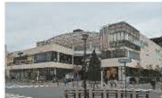
▲ボンテポルタ千住(約260m/徒歩4分)

「千住大橋」駅前にはショッピングやカフェ、レストラン、子ども向けサービスが整う大型ショッピング施設「ボンテポルタ千住」、近隣にはテニスコートを有するスポーツ公園や児童公園、少し足を伸ばせば清々しい川沿いのサイクルロードが点在。