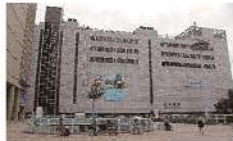
▲北千住駅(約1280m/徒歩16分)